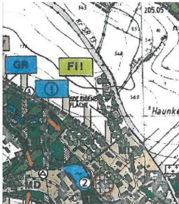
Auszug aus dem rechtswirksamen Flächennutzungsplan